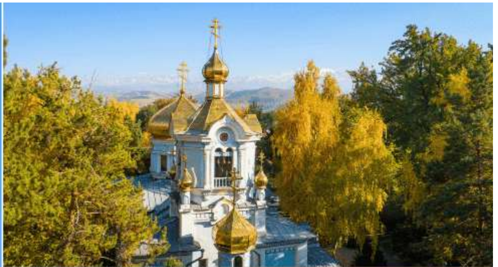
KAZAN ICON OF THE MOTHER OF GOD CATHEDRAL