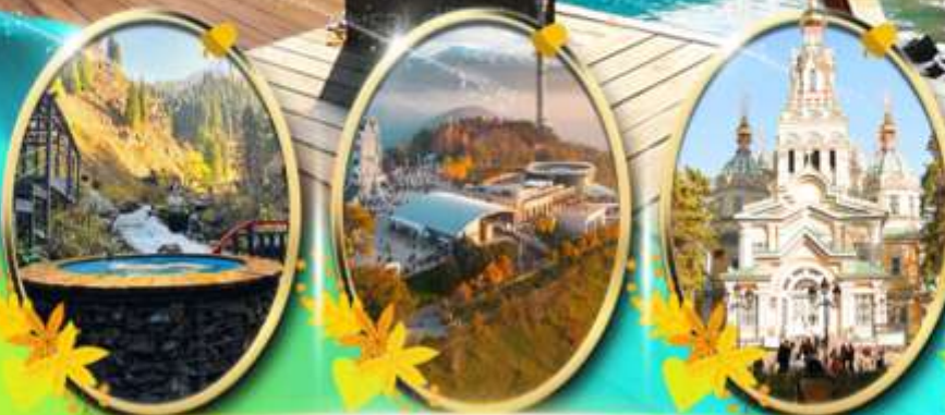
Alma Arasan Gorge