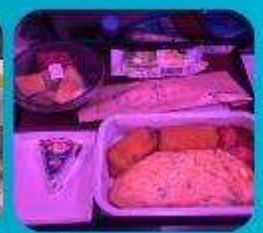
บริการอาหารร้อน ทั้งขาไป และ ขากลับ